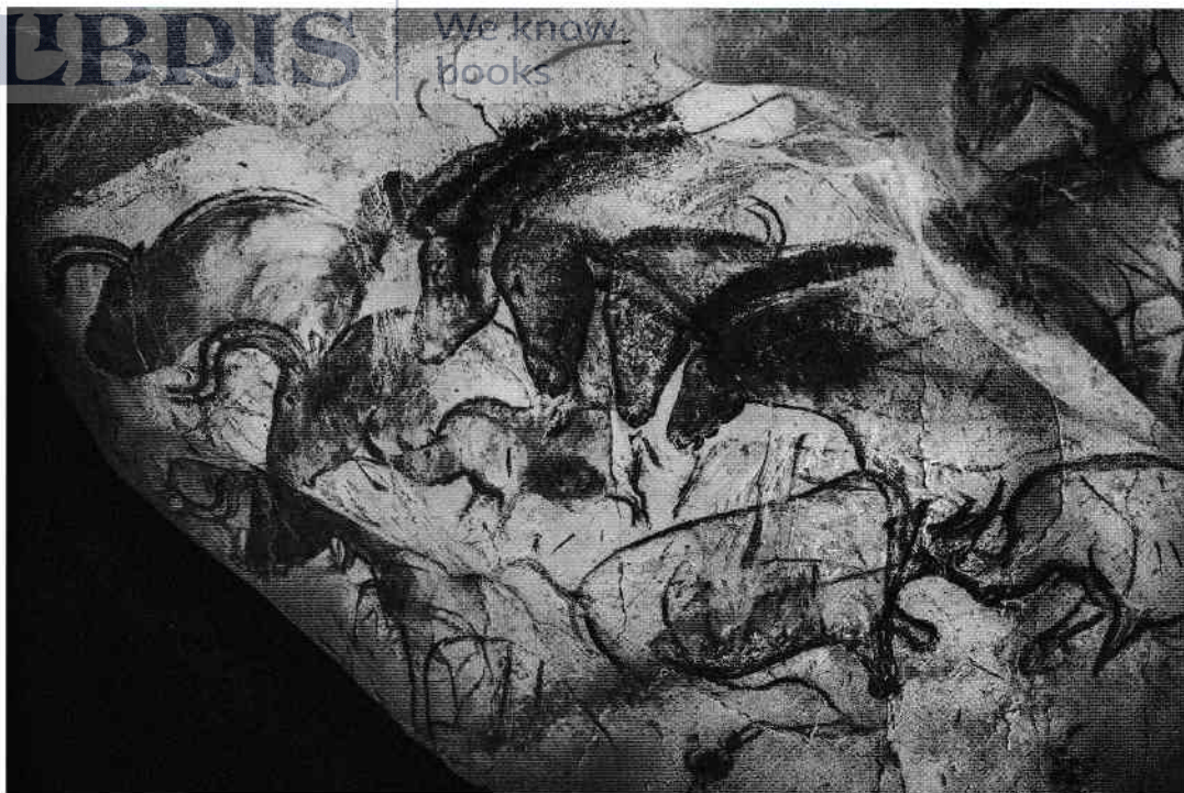
Cai, mamuți, rinoceri, grotă Chauvet, Vallon Pont d'Arc, cca 32000-30000 î.H.

Înainte de a schița imaginea „vie” în grotă, autorul ei văzuse asemenea cai și poate că exersase desenându-le conturul în țărână sau zgâriindu-l pe o piatră mică. Învățase să facă deosebirea între cai și alte animale cu ajutorul unui sunet care le-a devenit cu timpul nume, șoptindu-l poate pentru sine în timp ce-i desena. Linii fine sugerează volumul capetelor și molicimea coamelor, conferindu-le o expresie blândă și gânditoare. Caii s-au alăturat faunei care începuse să se reunească în grotă din sudul Franței (grotă Chauvet), printre rinoceri, mamuți lănoși și cerbi ce se luptau.