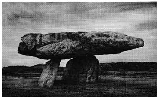
Dolmenul Bugun-ri, Ganghwa, Coreea de Sud, Mileniul I î.H.

Instinctul de creare a imaginilor a apărut probabil în urmă cu cincizeci sau șaiszeci de mii de ani. Cam acum douăsprezece mii de ani a început să se manifeste un al doilea instinct,