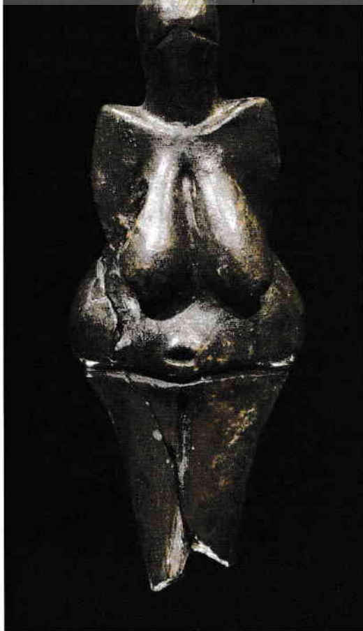
Siluetă feminină de la Dolni Vestonice, 29000–25000 î. H. Lut ars, înălțime 10,1 cm. Muzeul Moravske Zemske, Brno.

cu excepția a două fante diagonale în loc de ochi, astfel că femeia pare să poarte o glugă. Este cel mai vechi obiect cunoscut realizat prin arderea lutului în cuptor. Aveau să treacă cel puțin încă alți zece mii de ani înainte ca omul să ardă lutul pentru a confecționa obiecte utile, precum oalele. 7 Figurina de la Dolni Věstonice servise poate ca talisman - un obiect cu presupuse puteri magice -, dar nu este în niciun caz mai elegantă sau mai sugestivă decât leul ridicat pe două labe sau renii înotând. Omul se considera doar un alt animal printre celelalte, nicidecum cel mai frumos sau cel mai bine adaptat pentru a supraviețui într-o lume inospitalieră. 8