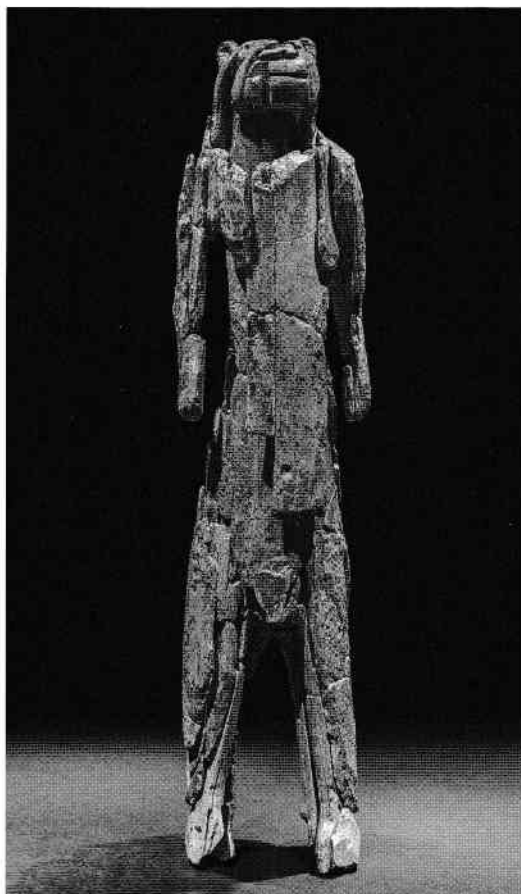
Silueta în picioare, posibil un leu, cu cca 40000 de ani în urmă. Fildeș de mamut, 31,1 cm înălțime, Muzeul din Ulm.

La câteva mii de ani după cioplirea leului ridicat, un alt artist timpuriu a luat un bulgăre de cărbune dintr-un foc stins și a început să traseze contururi pe peretele unei grotte. În lumina pâlپâitoare a unei torțe din lemn sau a unei lămpi cu ulei, imaginile par să se miște și să danseze: patru cai în galop pe un perete din piatră.