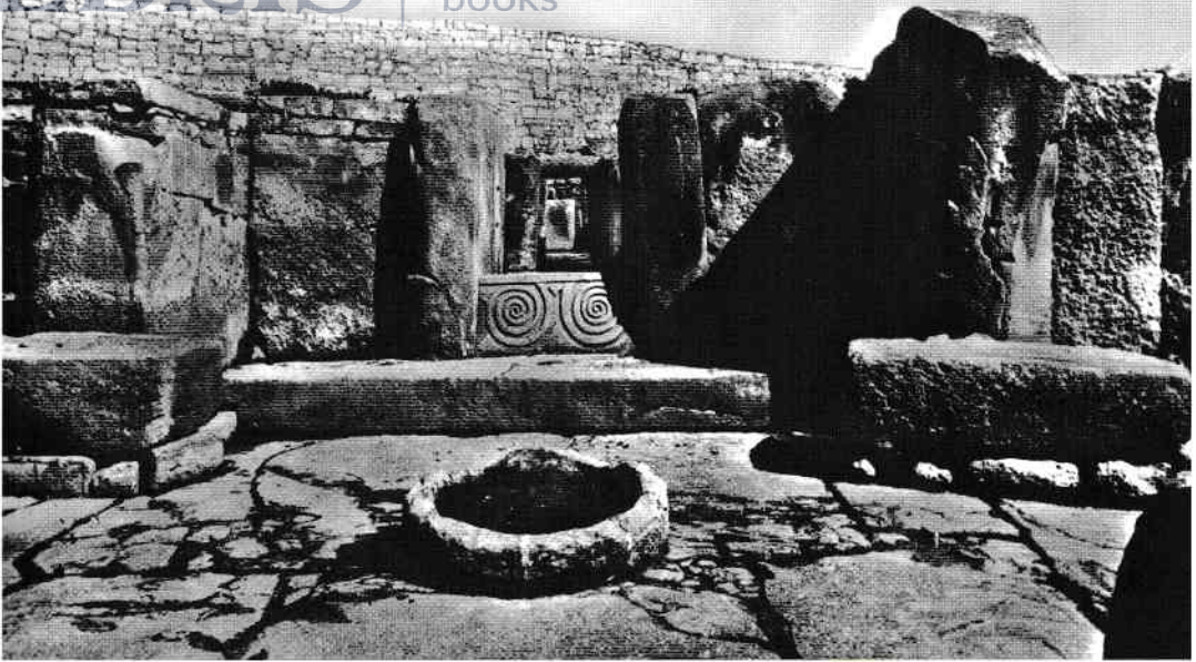
Templul Tarxien, Malta, cca 3000-1400 î.H.

dintre templele din Malta sunt dispuse astfel încât să ofere cea mai bună perspectivă asupra cerului nocturn. În absența calendarelor sau a altei modalități de consemnare a scurgerii timpului, mișcările și pozițiile constelațiilor erau singura cale de a ține socoteala anotimpurilor în schimbare – când era bine de semănat, când era așteptată ploaia, când era vremea culesului. Construcțiile erau ele însele mijloace de măsurare a trecerii timpului – ceasornice și calendare deopotrivă. Era o modalitate de supraviețuire și de orientare a vieții către viitor, ca o formă de predicție, dar și o cale de rememorare a trecutului. Mormintele cu galerie, care constau într-un coridor ce duce la o cameră mortuară situată mai jos, sub pământ, erau orientate spre răsărit. Un mormânt cu galerie din Newgrange, în Irlanda de astăzi, este aliniat cu punctul răsăritului la solstițiul de iarnă, astfel că o dată pe an razele soarelui pătrund prin galerie și luminează mormântul.